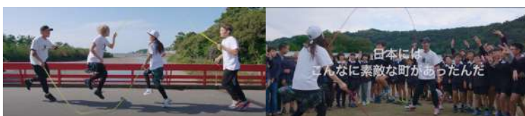
和歌山県印南町PR映像