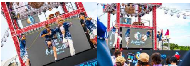
パフォーマンス&体験会@岡崎公園