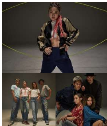
DENHAM Web CM