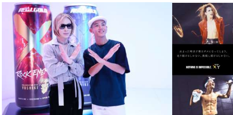
REAL GOLD X/Y YOSHIKI Brand Movie 「XY DNA~無敵の自分へ~」篇