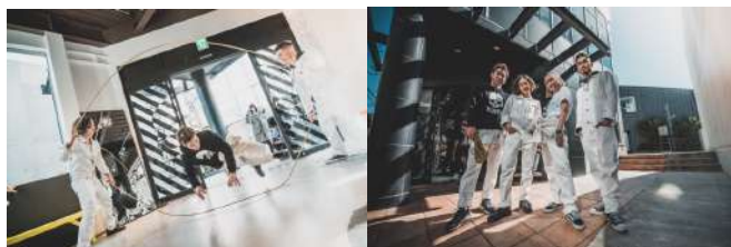
京都サンガF.C.試合前パフォーマンス